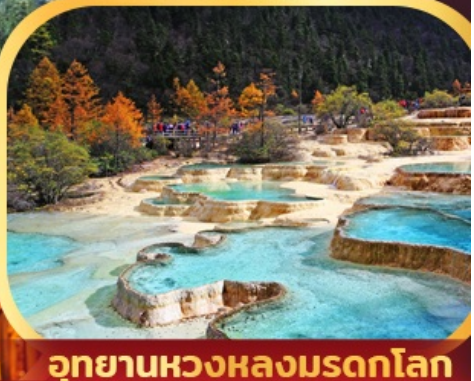
อุทยานหวงหลงมรดกโลก