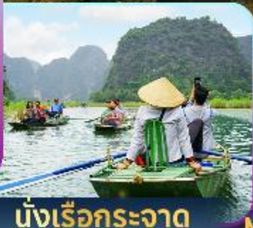
นั่งเรือกระจาด