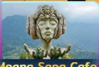
Moana Sapa Cafe