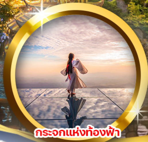
กระบอกแห่งท้องฟ้า