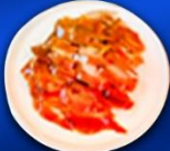
เสี่ยวหลงเปา+เปิดปักกิ่ง+สุกิมองโกล