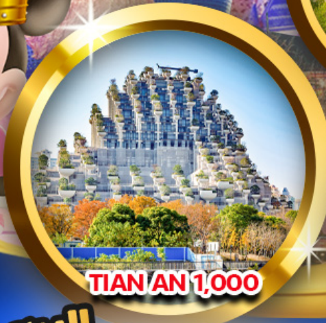
TIAN AN 1,000