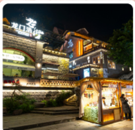
ตลาดโบราณหลงเหมินฮ่าว

ไฮไลท์ อุทยานเขานางฟ้า อุทยานแห่งชาติหลุมฟ้า 3 สะพานสวรรค์ พาหิณแคะสลักตัวภูเขาป่าตึ๊งชาน มรดกโลกระดับ 5 A