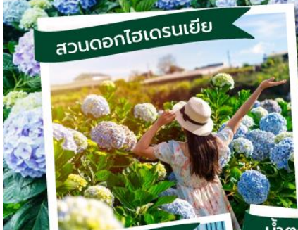
สวนดอกไฮเดรนเยีย