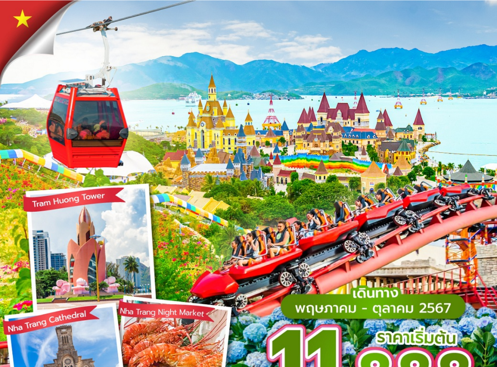
Tram Huong Tower