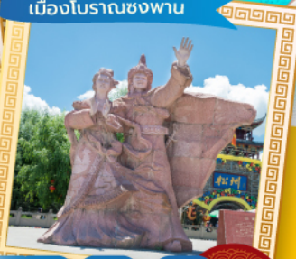
เมืองโบราณซงพาน