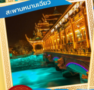
สะพานหนานเฉียว