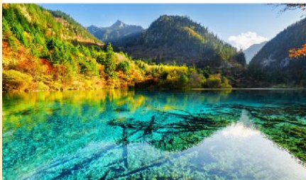
อุทยานแห่งชาติจิวจ้ายโกว