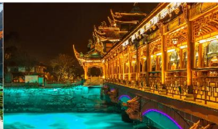
สะพานหนานเฉียว