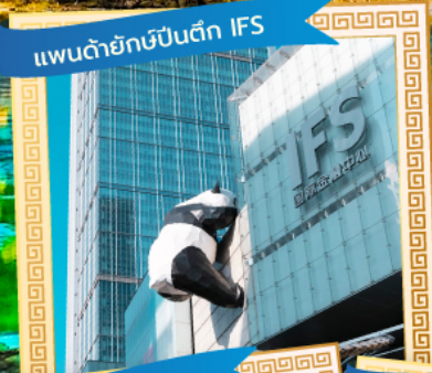
แพนด้ายักษ์ปิ่นตึก IFS