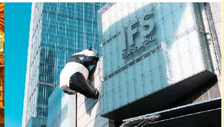
แพนด้ายักษ์ปิ่นตึก IFS

*ทางบริษัทฯ ขอสงวนสิทธิ์ในการสลับโปรแกรมทัวร์ตามความเหมาะสมขึ้นอยู่กับสถานการณ์หน้างาน โดยคำนึงถึงผลประโยชน์ของลูกค้าเป็นสำคัญ