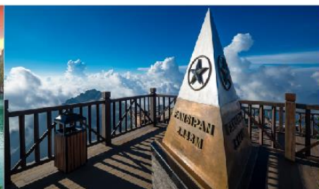
ยอดเขาฟานซิปิน