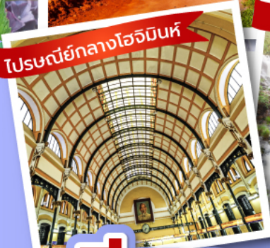
ไปรษณีย์กลางโฮจิมินห์