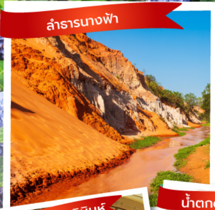
ลำธารนางฟ้า