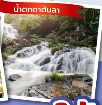
น้ำตกตาตันลา