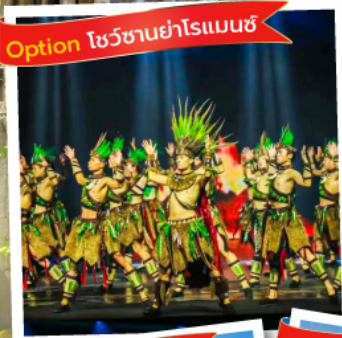
Option โชว์ชาวย่าโรแมนซ์