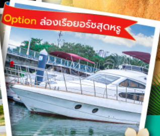
Option ล่องเรือยอร์ซุดหรู