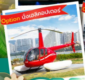
Option บั่งเฮลิคอปเตอร์