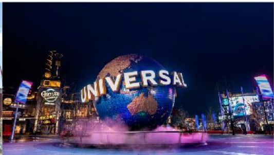
ยูนิเวอร์เซล ปักกิ่ง รีสอร์ท