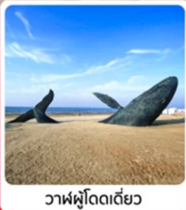
วาฬผู้โดดเดี่ยว