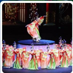
โซว FOSHAN QIANGUING