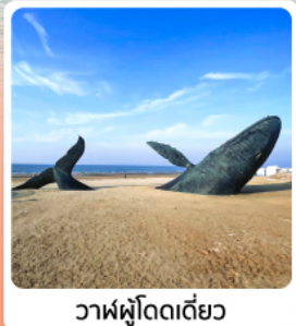
วาฬฟู่โถดเดี่ยว