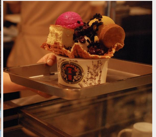
ร้านไอศกรีมมิยาฮาระ (Miyahara Ice cream)

นำท่านเดินทางสู่ ตลาดกลางคืนอี้จง (Yizhong Street Night Market) ที่นี้มีทั้งร้านอาหาร ของกิน ร้านเสื้อผ้า ร้านรองเท้า รวมไปถึงห้างสรรพสินค้า มีแต่ของกินของขึ้นชื่อที่ได้หวันเยอะแยะมากมาย ให้ท่านได้เลือกซื้อเลือกชื้อกันได้ตามอัธยาศัย