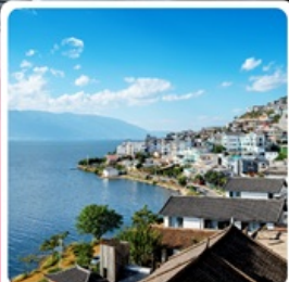
โคงตั่ว S ทะเลสาบเอ๋อร์ไห่