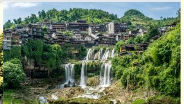
หมู่บ้านโบราณฟูหลงเจิน

*ทางบริษัทฯ ขอสงวนสิทธิ์ในการสลับโปรแกรมทัวร์ตามความเหมาะสมขึ้นอยู่กับสถานการณ์หน้างาน โดยคำนึงถึงผลประโยชน์ของลูกค้าเป็นสำคัญ