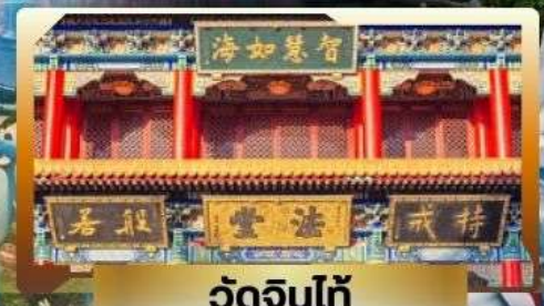
วัดจีนทิ่