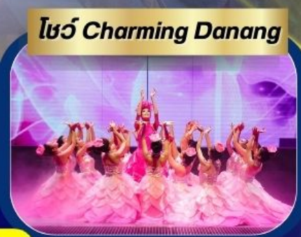
โชว์ Charming Danang