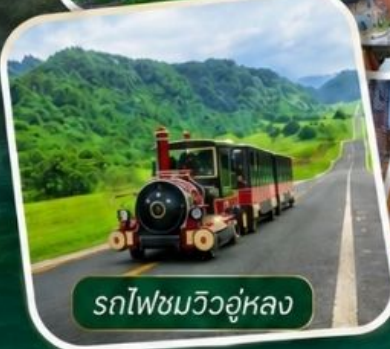
รถไฟขบวนวิวดูหลอง