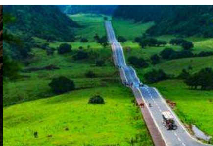
อุทยานเขาเนวฟ้า