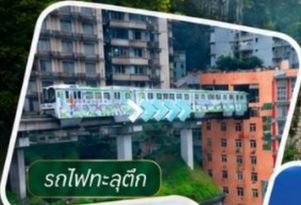
รถไฟทะเล