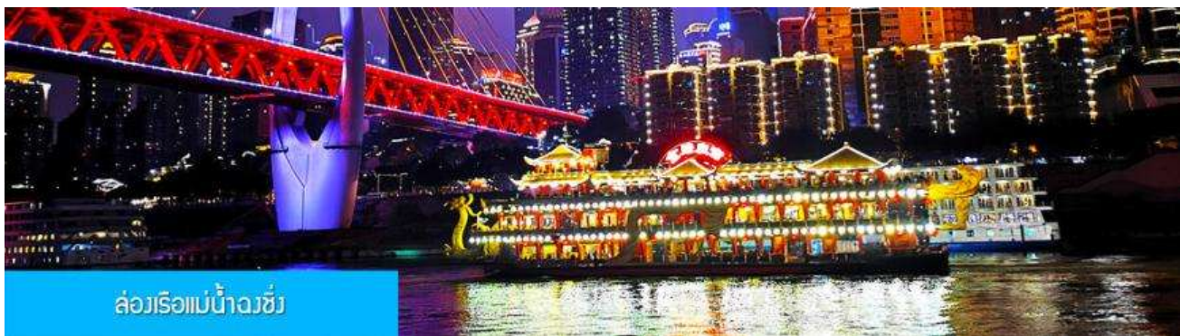
ล่องเรือแม่น้ำวงซิ่ง