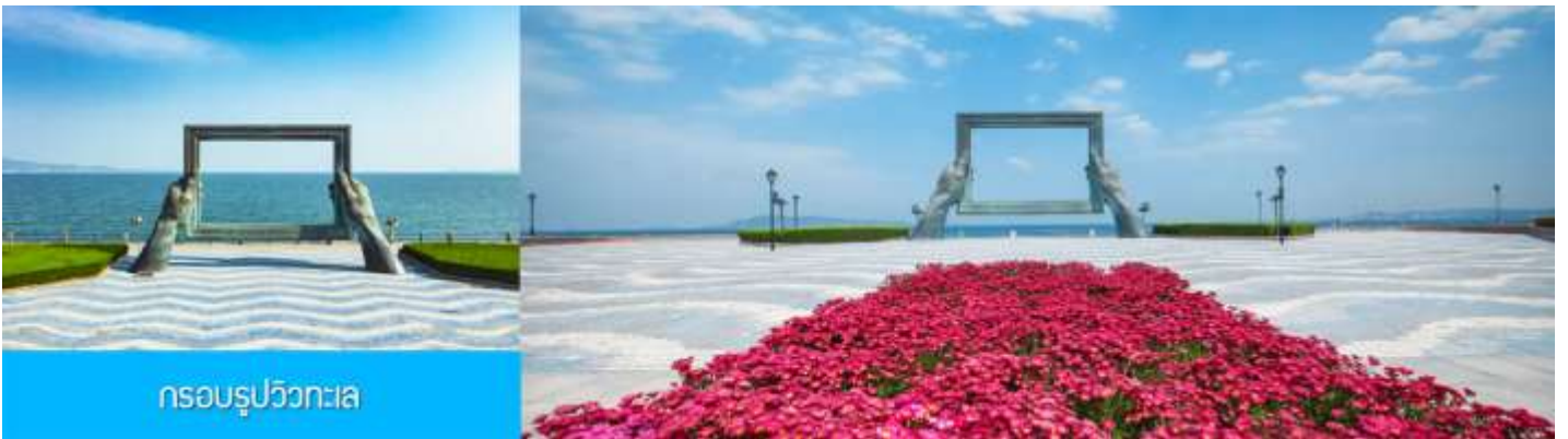
กรอบรูปวิวกทะเล

นำท่านชมและถ่ายภาพคู่กับ กรอบรูปยักษ์วิวกทะเล 威海公园大相框 แลนด์มาร์คที่เป็นอีกหนึ่งไฮไลท์ฮิตของเมืองเวย์ไห่