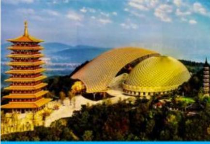
อุทยานหนิวสั่วซาน