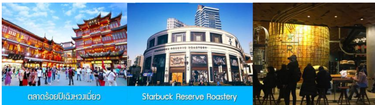
ตลาดร้อยปีฉงหวงเมี่ยว

พักที่ โรงแรม Holiday Inn Express Hotel 4* หรือเทียบเท่าในนครเซี่ยงไฮ้