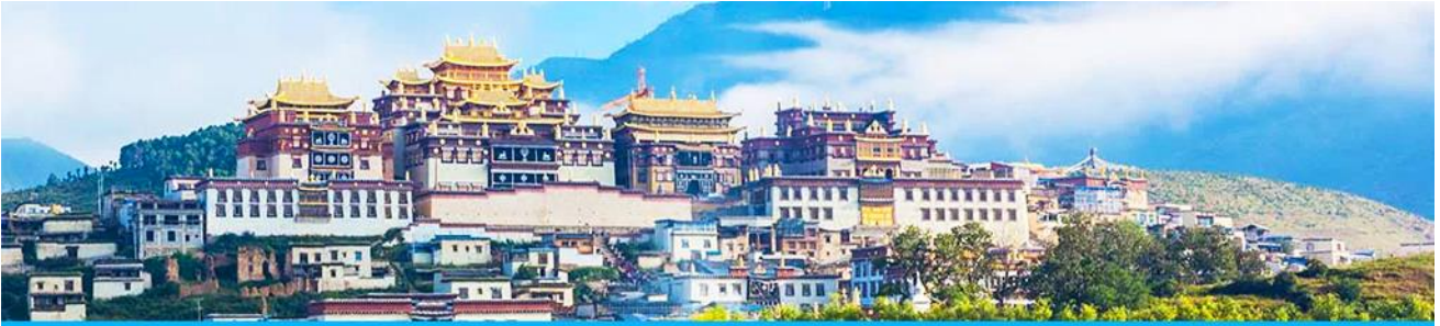
เมืองโบราณแห่งกริลา

จากนั้นนำท่านเดินทางสู่ เมืองจตุรัส โดยใช้เส้นทางด่วนวิ่งตรงเข้าเมือง จตุรัส ใช้เวลาเดินทางประมาณ 2 ชั่วโมง สู่ เมืองจตุรัส หรือดินแดนแห่งแห่งกริลา ซึ่งอยู่ทางทิศตะวันออกเฉียงเหนือของมณฑลยูนนานซึ่งมีพรมแดนติดกับอาณาเขตน่านซี ของเมืองลี่เจียง และอาณาจักรหิ ของเมืองหนิงหลง สถานที่แห่งนี้จึงได้ชื่อว่า ดินแดนแห่งความฝัน