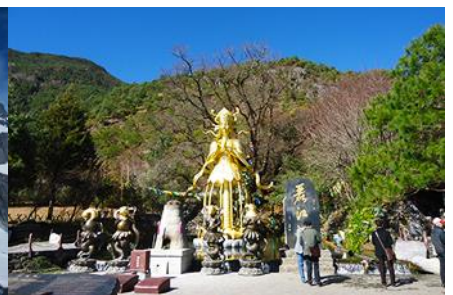
อุทยานน้ำหยก