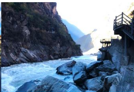
ช่องแคบเสือกระโจน