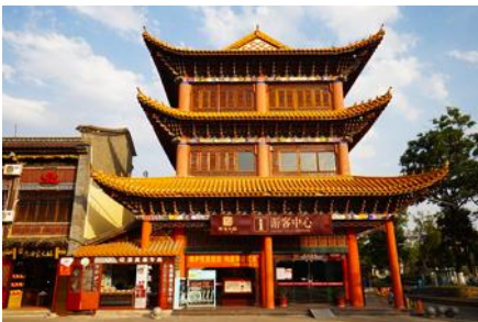
เมืองโบราณกวนตุ๋

เที่ยง รับประทานอาหารกลางวัน ณ ภัตตาคาร จากนั้นนำท่านเดินทางสู่ อุทยานน้ำหยก ซึ่งมีตาน้ำธรรมชาติผุดขึ้นมา 2 ตา เป็นน้ำที่ซึมมาจากการละลายของน้ำแข็งบนภูเขาหิมะมังกรหยก เป็นสถานที่ที่แสดงวัฒนธรรมของชนเผ่านาซีกลมกลืนกับธรรมชาติ.... นำท่านเดินทางสู่เมืองต้าหลี่ โดยใช้เวลาประมาณ 2 ชั่วโมง ค่ำ รับประทานอาหารค่ำ ณ ภัตตาคาร พักที่ FEI LONG HOTEL ระดับ 4 ดาว หรือเทียบเท่าในเมืองต้าหลี่