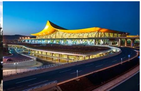
สนามบิณเมืองคุนหมิง

วันที่ห้า เมืองต้าหลี่ – เมืองคุนหมิง-วัดหยวนทง-เมืองโบราณกวนตุ๋- KUNMING WATERFALL PARK