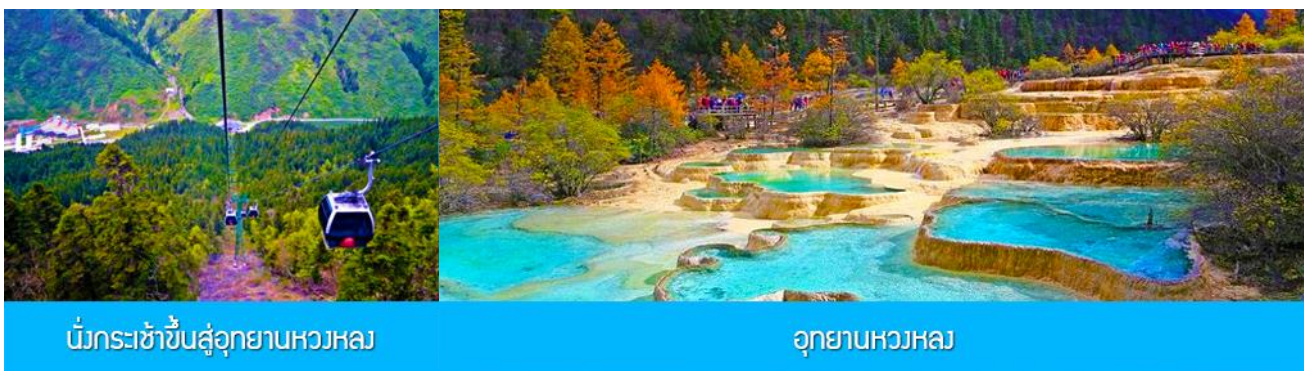
นั่งกระเช้าขึ้นสู่อุทยานหวงหลง

พักที่ JIUYUAN HOTEL ระดับ 4 ดาวท้องถิ่นหรือเทียบเท่าในอุทยานจิวจ้ายโกว