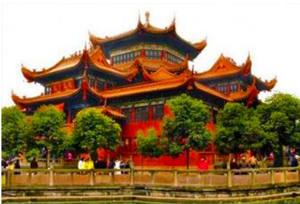
วัดเจาเจีย