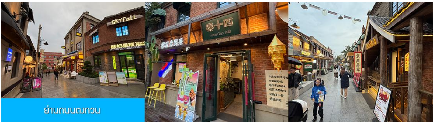
ย่านถนนตวงกวน