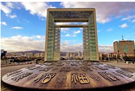
ประตูแห่งโชคกลาง