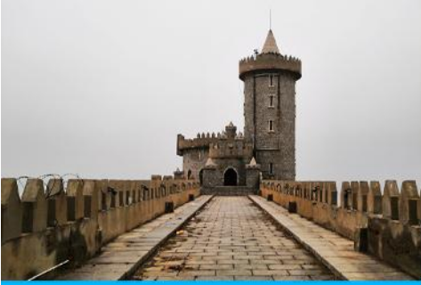
คาเฟ่อัสดง