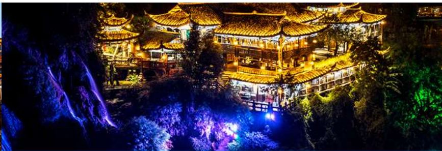
เมืองโบราณฝูหรงเจิ้น

วันที่สาม เมืองหยี่ซัง – เมืองจางเจียเจี๋ย – ตึกมหัศจรรย์ 72 ชั้น-ศูนย์แพทย์แผนจีน – เมืองโบราณฝูหรงเจิ้น