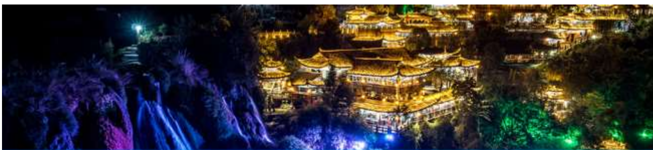
เมืองโบราณ ฝูหรงเจิ้น

หลังอาหารนำท่านเที่ยวชมเมืองโบราณฝูหรงเจิ้นยามราตรีที่ประดับประดาด้วยแสงสี ชมน้ำตกกลางเมือง