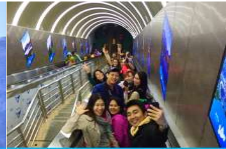
บันไดเลื่อนทะเลภูเขา

วันที่ห้า เมืองโบราณฟงหวง-เมืองจางเจียเจีย-ศูนย์ผลิตภัณท์ยางพารา- กระเช้าขึ้นเขาเทียนเหมินซาน ระเบียบแก้วเลียนหน้าผา - บันไดเลื่อนทะเลภูเขา - (เลือกซื้อโปรแกรมเสริม โชว์ / จิ้งจอกขาว หรือ เมย์ลี่เซียงซี)