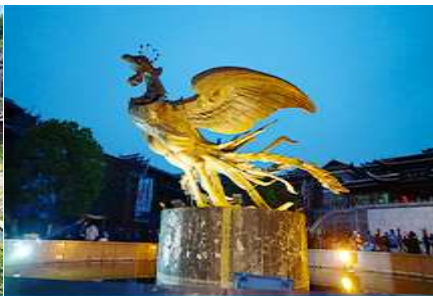
เมืองโบราณฟงหวง