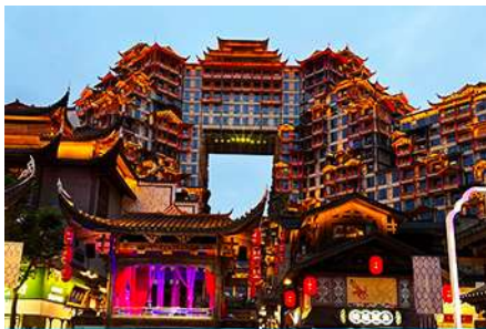
ตึกมหัศจรรย์ 72 ชั้น

รับประทานอาหารค่ำ ณ ภัตตาคาร (อาหารมื้อพิเศษ Wedding Banquet) พักที่ YICHANG MEIJI BOYUE HOTEL โรงแรมระดับ 4 ดาวหรือเทียบเท่าในเมืองหยี่ซัง