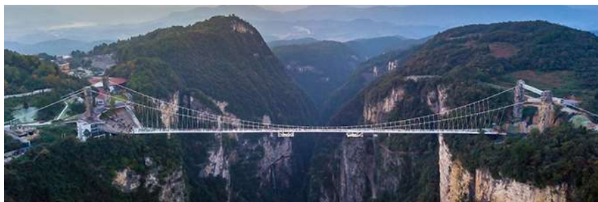
สะพานกระจกจางเจียเจีย

อัตราค่าบริการสำหรับโปรแกรมเสริมการแสดงชุด The love Story of Wooden man and Fairy Fox ท่านละ 400 หยวน (หรือ 2,000 บาทขึ้นอยู่กับอัตราแลกเปลี่ยน) ระยะเวลาที่ใช้ในการเที่ยวชมการแสดง ประมาณ 3 ชั่วโมง รวมเวลาเดินทางไป กลับค่าบริการรวม ค่าบัตรเข้าชม ค่ารถรับ ส่ง และค่าน้ำดื่มของไกด์ท้องถิ่น พักที่ GUIYUANZHENPIN HOTEL โรงแรมระดับ 4 ดาวหรือเทียบเท่า