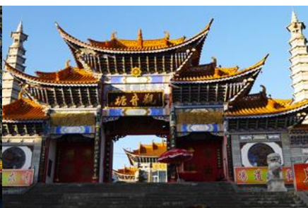
วัดเจ้าแม่กวนอิมแปลงกาย