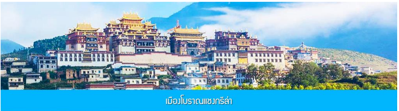
เมืองโบราณเซงกรี่ล่า

จากนั้นนำท่านชม หมู่บ้านซีโจวหรือหมู่บ้านชาวไป่ ชนพื้นเมืองที่สำคัญของเมือง ชมการแสดงของชนชาติปายพร้อมชิมชาสามแก้ว เพื่อรำลึกถึงวิถีชีวิตและการเกิดมาเป็นมนุษย์ของตนเอง ซึ่งถือเป็นเอกลักษณ์ของชนชาวไป่ ที่หาดูได้ยาก