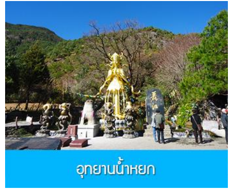
อุทยานน้ำหยก

วันที่ 1 ภูเขาหิมะมังกรหยก (รวมนั่งกระเช้าใหญ่ขึ้นลง)– หุบเขาพระจันทร์สีน้ำเงิน-น้ำตกไปสู่ยเหอ ออฟชั่น ไกด์ขายรถอล์ฟ ท่านละ 80 หยวน โชว์ IMPRESSION LIJIANG- อุทยานน้ำหยก -ต้าหลี่