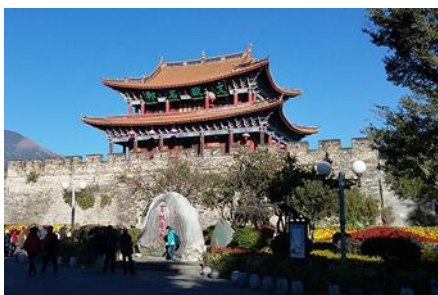
เมืองโบราณต้าลี่

18.26 น. เดินทางถึงเมืองต้าลี่ นำท่านสู่ภัตตาคารในเมืองต้าลี่ ค่ำ รับประทานอาหารค่ำ ณ ภัตตาคาร หลังอาหารนำท่านเข้าสู่ที่พัก พักที่ DALI ZHUANG HOTEL ระดับ 4 ดาวหรือเทียบเท่าในเมืองต้าลี่