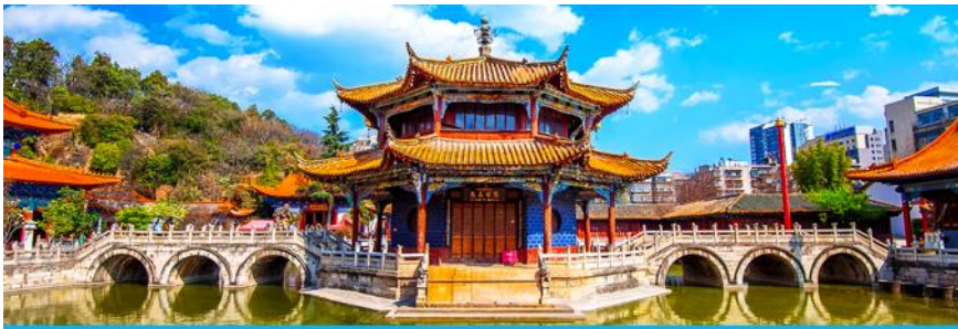
วัดหยวนกวง