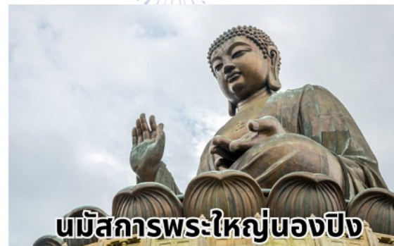
นมัสการพระใหญ่นองปิง