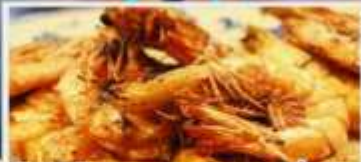
พิเศษ! อาหารทะเล เหล่า หยู หนูน