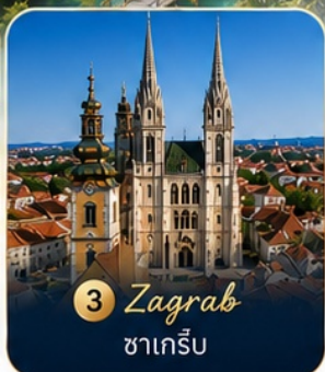
3 Zagreb ซาเกร็บ