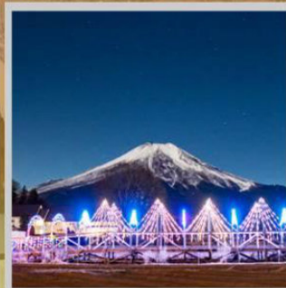
"YAMANAKAKO ILLUMINATION FANTASEUM"