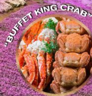
"BUFFET KING CRAB"