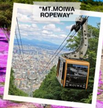
"MT. MOIWA ROPEWAY"

OBIHIRO / FURANO / BIEI / SOUNKYO / KITAMI / MOMBETSU / TAKINOUE / KAMIKAWA / SAPPORO / OTARU / PINKMOSS