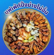
อาหารพรีเมียม ไม่ลงร้านอาหาร