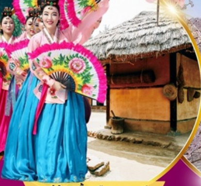
หมู่บ้านพื้นเมืองเกาหลี