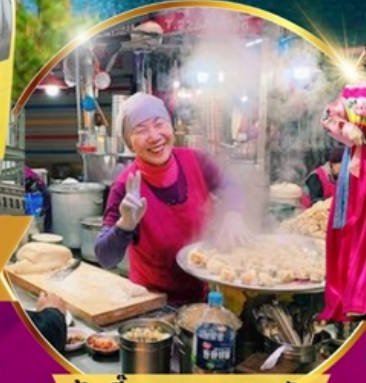
ป่าเกี้ยว ตลาดกวางจง