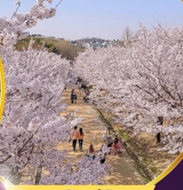
ชมซากุระ Seoul Forest