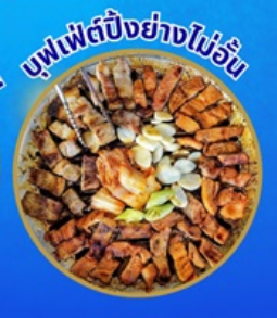
บุฟเฟ่ต์ปิ้งย่างไม่อั้น