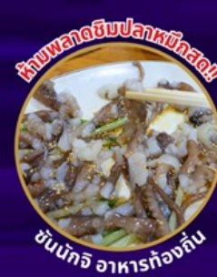
ห้ามพลาดอินปลาหมึกสด!!

ถ่ายรูปชิคๆ หมู่บ้านวัฒนธรรมคัมซอน เชคอิน คาเฟ่ริมทะเล วิวหลักล้าน ขึ้นเคเบิลคาร์ ชมทะเลปูซาน นั่งรถไฟปิ๊งปิ๊ง sky capsule ห้ามพลาด!! ตลาดปลาที่ใหญ่ที่สุด ชิมของอร่อยที่ตลาดแฮอนแด อิสระช้อปปิ้ง Lotte Duty Free