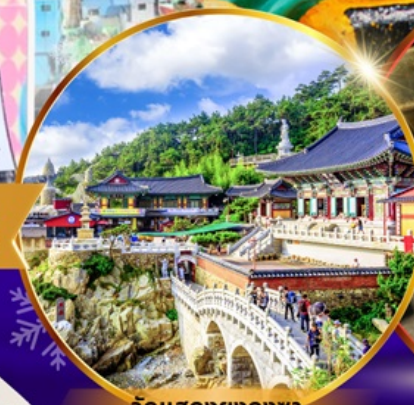
วัดแฮดงยงกุงซา