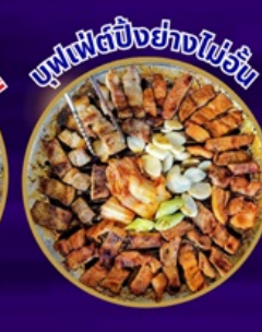
ซูฟเฟ็ตปังย่างไข่ม้วน