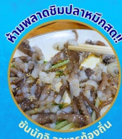
ห้ามพลาดชิมปลาหมึกสด!!

โพฮังสเปซวอล์ค สกายวอร์ค ตามรอยซีรีส์ Hometown chachacha ถ่ายรูปชิคๆ หมู่บ้านวัฒนธรรมคิมซอน ขึ้นเคเบิลคาร์ ชมทะเลปูซาน นั่งรถไฟปูคปิก sky capsule ชิมของอร่อยตลาดแฮนแด อิสระช้อปปิ้ง Lotte Duty Free