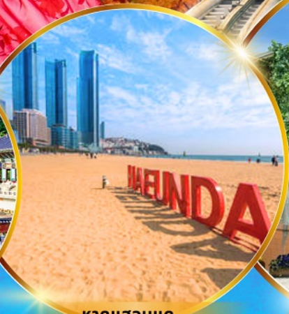
หาดแฮนแด