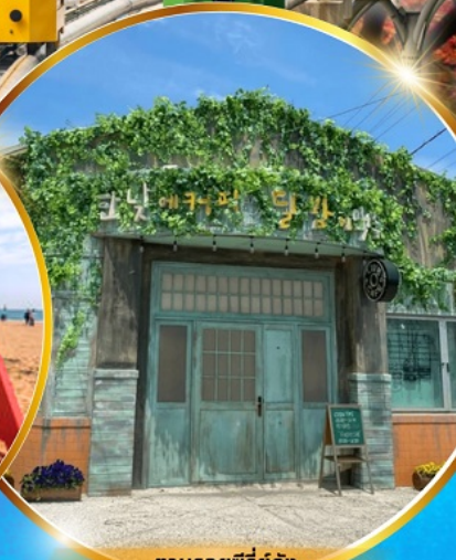
ตามรอยซีรีส์ดัง Hometown chachacha

โพฮังสเปซวอล์ค สกายวอร์ค ตามรอยซีรีส์ Hometown chachacha ถ่ายรูปชิคๆ หมู่บ้านวัฒนธรรมคิมซอน ขึ้นเคเบิลคาร์ ชมทะเลปูซาน นั่งรถไฟปูคปิก sky capsule ชิมของอร่อยตลาดแฮนแด อิสระช้อปปิ้ง Lotte Duty Free