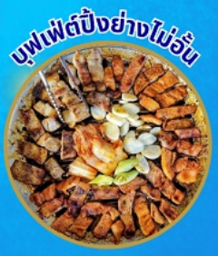
บุฟเฟต์ปิ้งย่างไม่อั้น