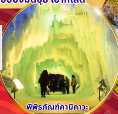
พิพิธภัณฑ์คามิดาวะ