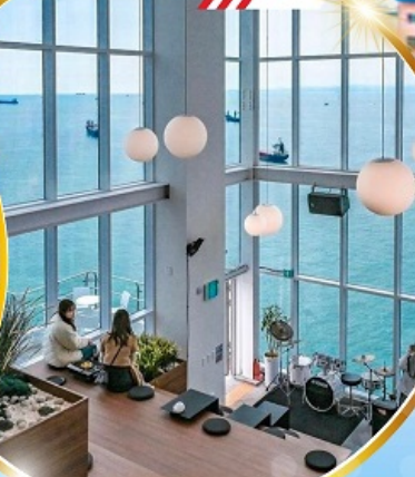
คาเฟ่วิวทะเล