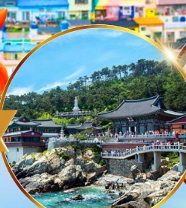
วัดแสดงยงกุงซา