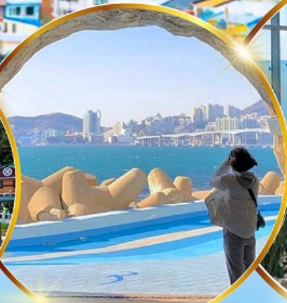
หมู่บ้านริมทะเล