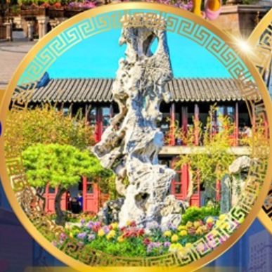
สวนหลิวหยวน

ถนนหนานจิงลู่ หาดไว่ทาน ชมหอไข่มุก ล่องเรือทะเลสาบซีหู ตำนานพญางูขาว เจดีย์เหลยเฟิง ถนนเลี้ยวเหอจือเจีย วัดหลงหยวน สวนหลิวหยวน ซุปป์ปิง ถนนกวนเจี้ยนเจีย ถนนซีหลี่ซานถึง วัดพระหยก เซคอินย่านเก่าซินเทียนตี้ สักการะศาลเจ้าพ่อหลี่เหมิง