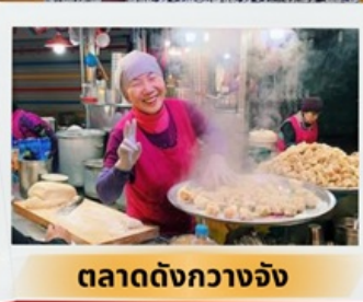
ตลาดดังกวางจ้ง