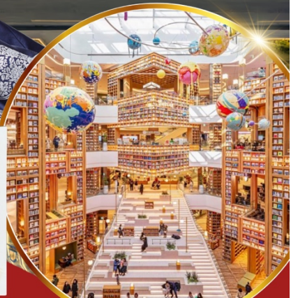
ห้องสมุด สตาร์ฟลัด ซูวอน

เชคอินห้องสมุดสุดอลังการ ชมศิลปะดิจิทัลสุดล้ำ บนจอ LED เสมือนจริงขนาดยักษ์ หมู่บ้านเกาหลีโบราณมุกซอน อีนอก อิสระช้อปปิ้ง 2 ย่านดัง ซองซู เมียงดง ช้อปปิ้งปลอดภาษี Lotte Duty Free