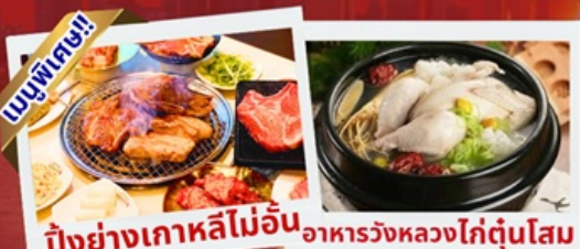
ปิ้งย่างเกาหลีไม่อื่น อาหารวังหลวงไก่ตุ๋นโสม