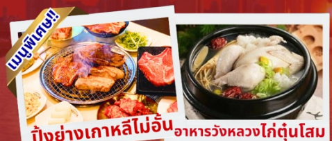
ปิ้งย่างเกาหลีไม่อื่น อาหารวังหลวงไก่ตุ๋นโสม

เชคอินห้องสมุดสุดอลังการ ชมศิลปะดิจิทัลสุดล้ำ บนจอ LED เสมือนจริงขนาดยักษ์ หมู่บ้านเกาหลีโบราณมุกซอน อีนอก อิสระช้อปปิ้ง 2 ย่านดัง ซองซู เมียงดง ช้อปปิ้งปลอดภาษี Lotte Duty Free