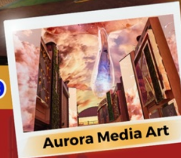
Aurora Media Art