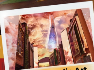
Aurora Media Art