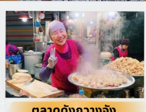
ตลาดดังกวางจง