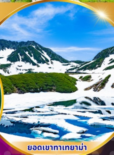
ยอดเขาทาเกยาม่า

พักรองแรม 3 ดาว ★★★★★ ฟรี ประกันอุบัติเหตุ บริการอาหารท้องถิ่น