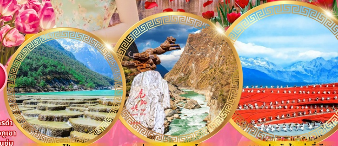
ทะเลสาบไป๋สยเหอ

วัดชงจันหลิน ช่องแคบเสือกะโจน สระมังกรดำ เมืองโบราณลี่เจียง ภูเขาหิมะมังกรหยก ชมวิวภูเขา หิมะที่ร้าน Yun di ta ชมดอกไม้ที่สวนอุทยานชุ่ม น้ำโกวหนาน ชมดอกซากุระสวนหยวนทง