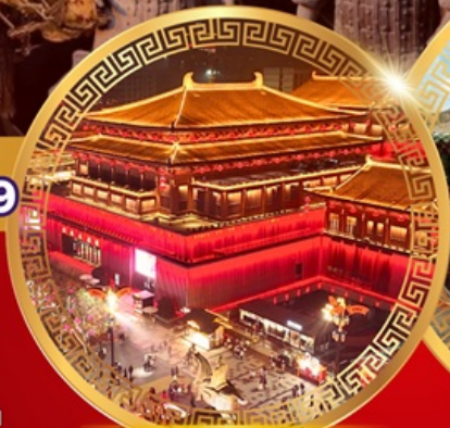
ย่านถนนคนเดินต้าถิง

วัดเล่าหลิน การแสดงโชว์กังฟู ป่าเจดีย์วัดเล่าหลิน ศาลเจ้ากวนอู ชมถ้ำผาหลงเหมิน จัตุรัสหอกลอง จัตุรัสหอรบะซิง ตลาดมุสลิม อุทยานจีนซีอองเต้ กำแพงเมืองซีอาน ชมเจดีย์ห่านป่าใหญ่ ย่านถนนคนเดินต้าถิง