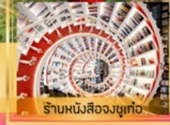
ร้านหนังสือจุงเก๋