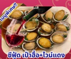
ซีฟู้ด เป้าอ้อ+ไวน์แดง