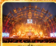
สถานที่จัดงาน เทศกาลเบียร์ชิงเต่า