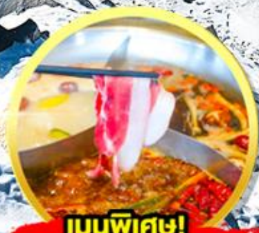
เมนูพิเศษ! สุกัหม่าล่าเสฉวน