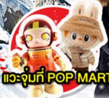
แวะจุ่มที่ POP MART