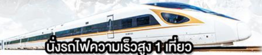
นั่งรถไฟความเร็วสูง 1 เที่ยว