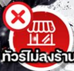
ทัวร์ไม่ลงร้าน!