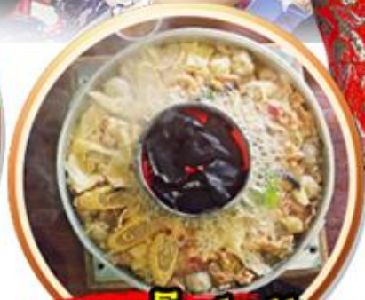
เมนูพิเศษ!! สุกี้เห็ดโตดำ+ปลาเซลมอน