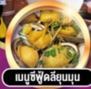
เมามูซีฟูคัสี่ยมบุน